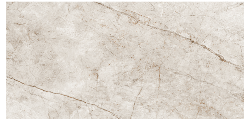
Rain Forest White 60x120 R