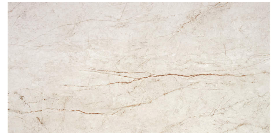
Rain Forest White Pul 60x120 R