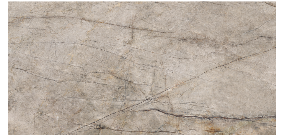
Rain Forest Natural Pul 60x120 R