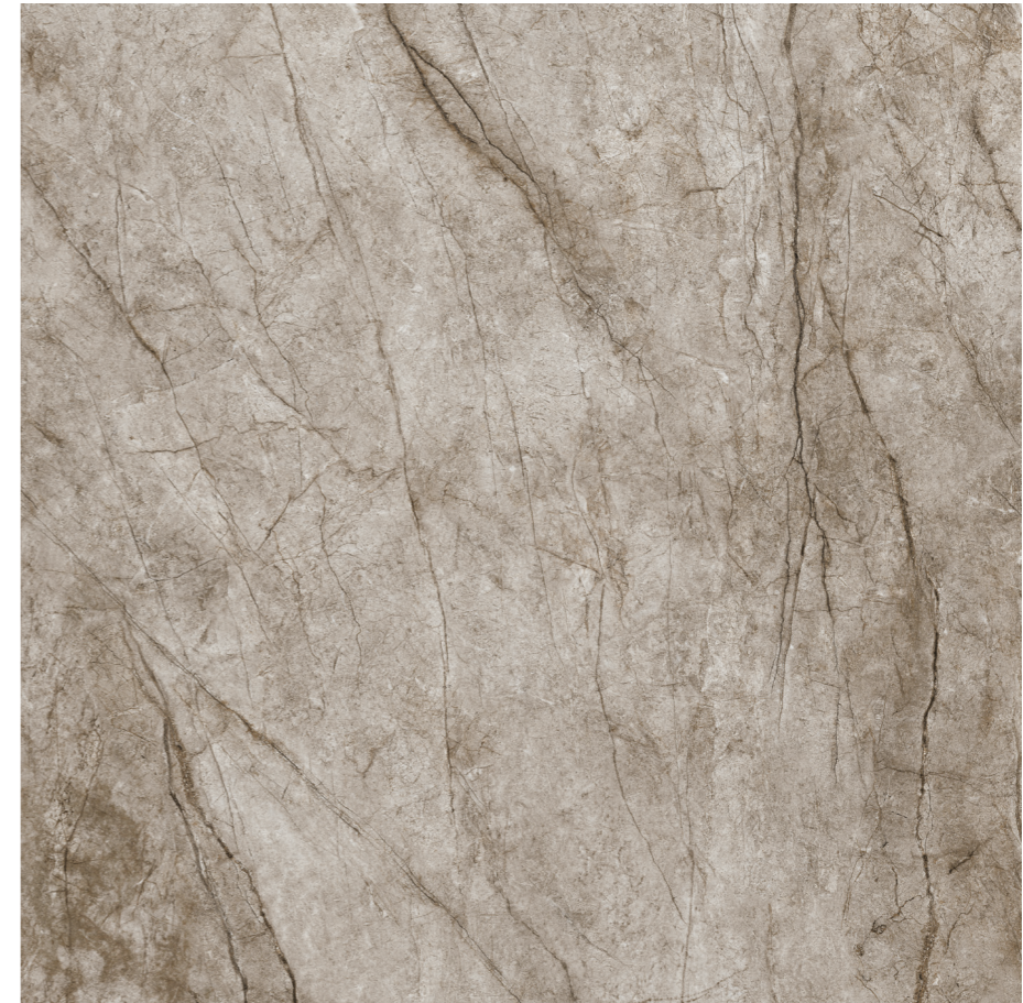
Rain Forest Natural Pul 120x120 R