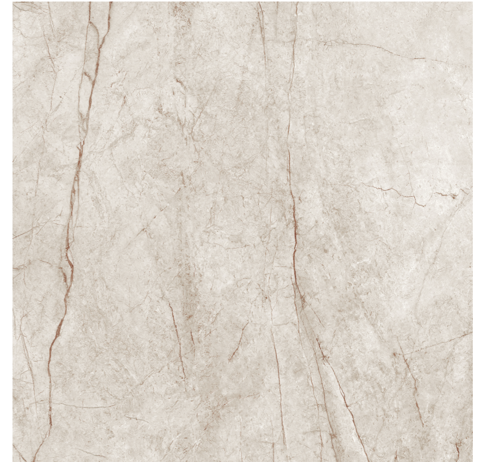
Rain Forest White Pul 120x120 R