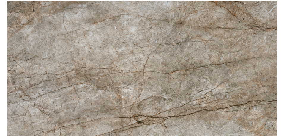
Rain Forest Natural 60x120 R