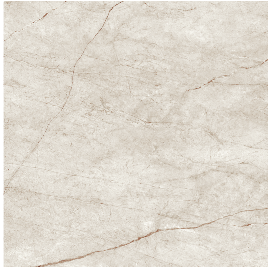
Rain Forest White Pul 120x120 R